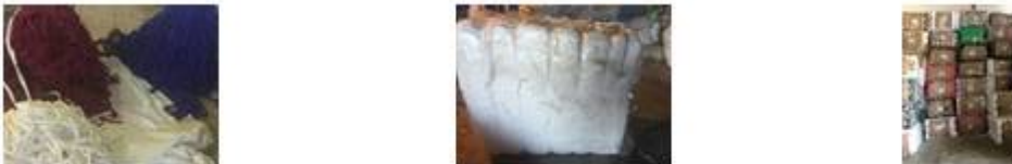
Photos du produit bio pour nettoyage des tâches