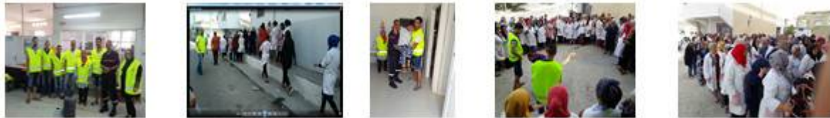
Photos du centre de triage des déchets