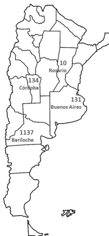
Localización del equipo

Remuneración y nivel laboral: Fijamos la remuneración de un ingresante a partir de una tabla de doce niveles laborales según la experiencia, los conocimientos acreditados y la complejidad de la función asignada. Esta clasificación no es un escalafón y el avance de cada persona se da acorde a su desempeño, la experiencia ganada y las responsabilidades asignadas.