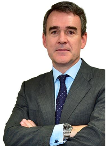
Mikel Echavarren CEO

Seguros de nuestras convicciones, desde irea ratificamos nuestra adhesión al Pacto Mundial, nuestro compromiso con el mismo y nuestra firme determinación en seguir avanzando en la implantación y difusión de sus principios.