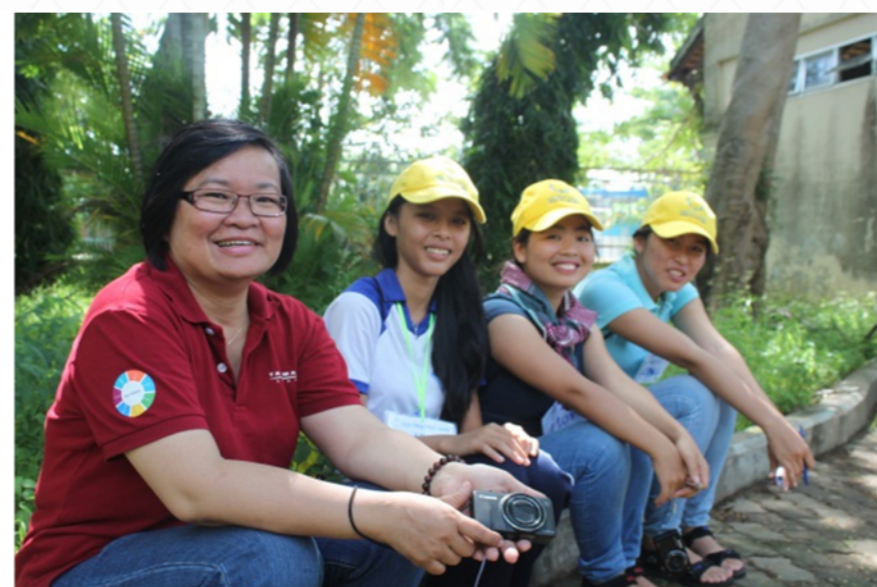
Các nữ sinh tham gia buổi thảo luận hướng nghiệp với các tình nguyện viên của Talisman tại Trại hè 2014

“ Học bổng đã giúp tôi được đến trường. Trước đây, ý định bỏ học để giúp đỡ gia đình kiếm sống thường xuyên xuyên trong tâm trí của tôi, mặc dù tôi thích đi học. Tuy nhiên, tôi đã thay đổi suy nghĩ của mình kể từ khi tôi nhận được học bổng này. Tôi phát hiện ra rằng chỉ có học mới giúp tôi đạt được một tương lai tốt hơn. Nhờ có học bổng, tôi không lo lắng về tiền bạc nữa. Bây giờ mới quan tâm duy nhất của tôi là học mà thôi ” - Người nhận học bổng