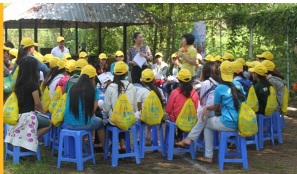
The girls joining Career Orientation session shared by Talisman's volunteers at 2014 Summer Camp

“ The scholarship enabled me to go to school. Before, the idea of dropping out school to help my family earn a living was frequently in my mind, even though I love studying. However, I changed my mind since I got the scholarship. I found out that only by studying, I could achieve a better future. Thanks to the scholarship, I do not worry about money for school any more. Now my concern is studying. ” - Scholarship Recipient