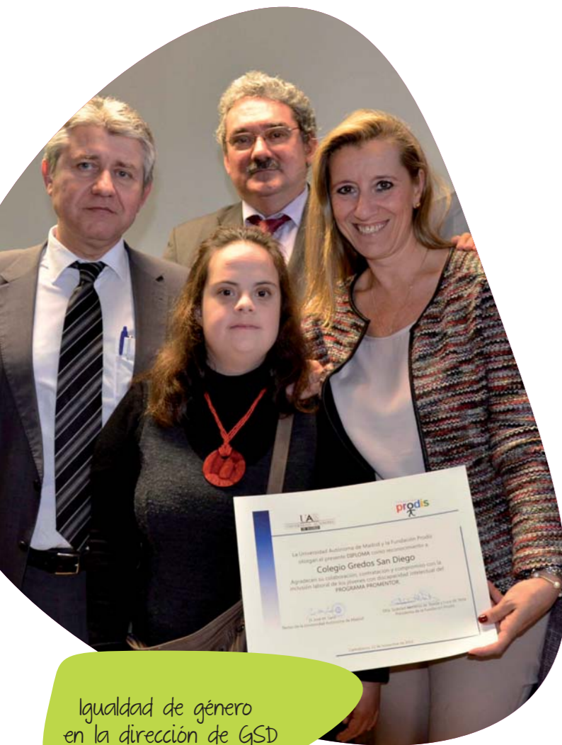
Igualdad de género en la dirección de GSD

Tomando datos medios del curso 2013/2014, el 68,25 % de los trabajadores de GSD son mujeres, y cabe destacar que las mujeres ocupan el 48,48 % de los puestos de dirección (gerencia, directores, jefes y mandos intermedios).