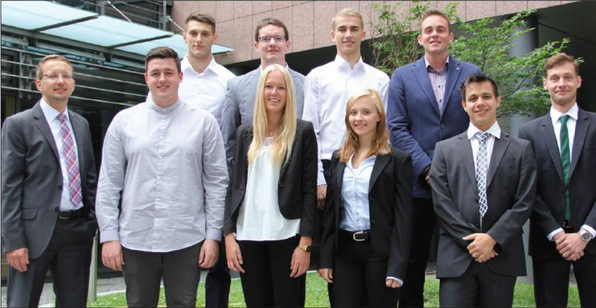
Stellvertretend für alle neuen Auszubildenden: Die neuen Münchener Auszubildenden mit den Personalreferenten (re. und li.)