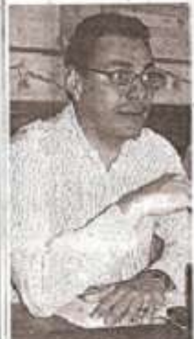
El representante de los restaurantes Toks durante la campaña de concientización.