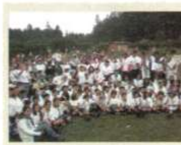
Parque Nacional El Chico, Pachuca.