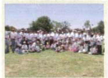
Cañada Bolaños, Querétaro.