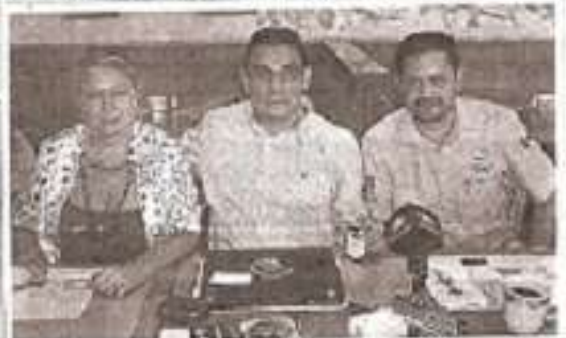
En la imagen se muestra a los representantes de los restaurantes Toks y Plaza Caracol durante una reunión con autoridades de la Comisión Nacional de Áreas Naturales Protegidas del Edo Ameca.

Además, se han implementado programas de concientización para el personal de los restaurantes, con el fin de promover el uso responsable de los recursos naturales.