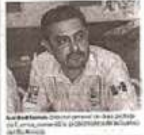
El representante de los restaurantes Plaza Caracol durante la campaña de concientización.