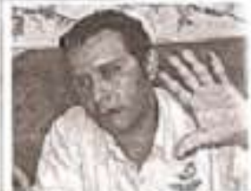
El representante de los restaurantes Plaza Caracol durante la campaña de concientización.