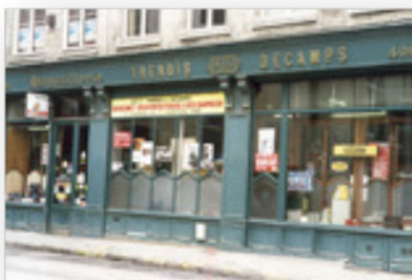
Trenois Decamps à Lille (1903)