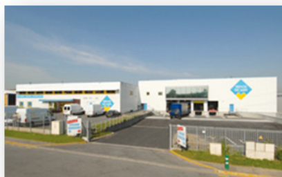
Siège Social à Wasquehal (1990)